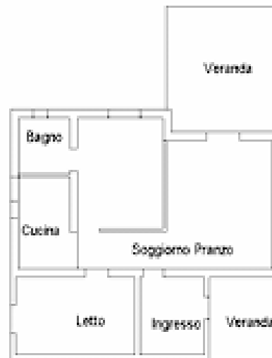
Piano Terra n 2.70